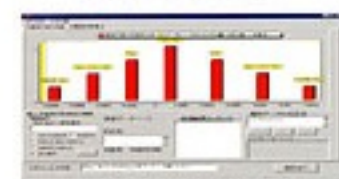
③のデータの分布表示