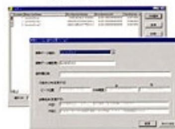
データベース管理画面