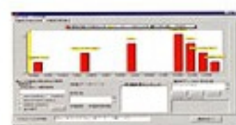
①のデータの分布表示