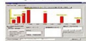
②のデータの分布表示